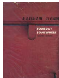
石元泰博 “ある日ある所” 芸美出版社、1958年