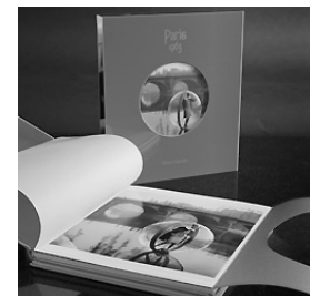
Melvin Sokolsky “Paris 1963/Paris 1965” (Bubble edition) Leafcar Edition, 2011