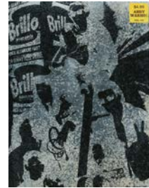
Andy Warhol “ANDY WARHOL'S INDEX BOOK” Random House, 1967