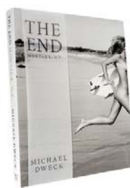
Michael Dweck “The End: Montauk. N.Y. ” Ditch Plains Press, 2016