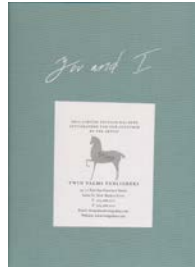
Ryan McGinley “You and I”(Slipcased Edition of 150 signed copies) Twin Palms, 2011