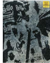
Andy Warhol “ANDY WARHOL'S INDEX BOOK” Random House, 1967