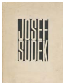
Josef Sudek “Josef Sudek Fotografie” Statni Nakladatelstvi Krasne Literatury, 1956