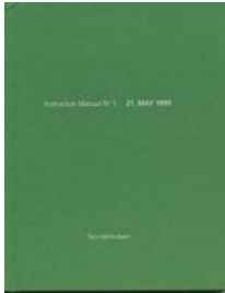
Terri Weifenbach “Instruction Manual No. 1: 21 May 1995.” Nazraeli, 2000